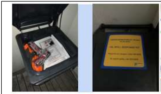
Mynd 1 Sýnir eins umgjörð mengunarvarnarbúnaðar.