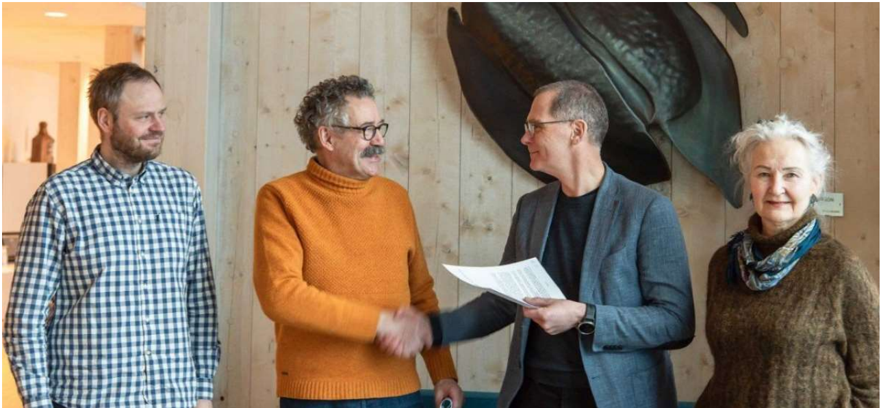
MYND 3 FRÁ UNDIRRITUN VILJAYFIRLÝSINGAR HJÁ HAFRÓ